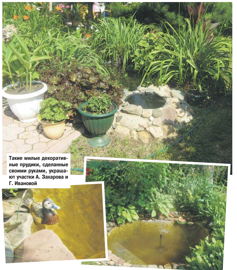
Такие милые декоративные прудики, сделанные своими руками, украшают участки А. Захарова и Г. Ивановой

Сначала выройте углубление на 30 см по периметру пруда: стенки должны быть вертикальными. Вынутую почву можно использовать для прибрежного мелководья. Далее, отступив от края 45 см, а еще лучше 60 см, роите центральную область глубиной 90 см. Вертикальные стенки котлована желательнее укреплять кирпичом или камнем. Нижний почвенный горизонт сохраните для дальнейшего использования в качестве грунта в водоеме.